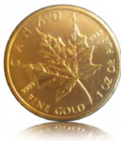
Syiling Canadian Maple Leaf