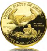
Syiling America Eagles