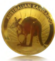
Syiling Australian Kangaroo