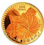
Syiling Kijang Emas

Hanya tiga produk ini saja yang kita patut beli. Sebenarnya, macam Zamri cakap tadi produk-produk emas ini banyak, termasuk syiling emas sendiri. Kita di Malaysia pun ada syiling emas Kijang Emas. Di Singapura ada Gold Lion.