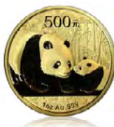
Syiling Chinese Panda